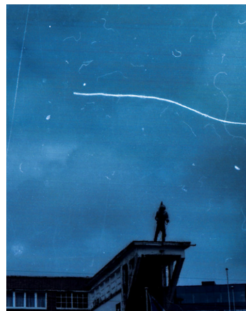
Nathalie Visser — Space to Dream